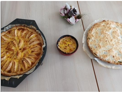
Les bonnes tartes confectionnées ensemble