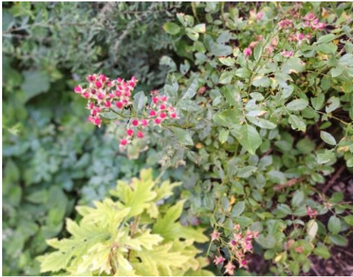
Le très particulier rosier « fraises des bois » que nous avons admiré au Jardin de Pierrette à Diebolsheim

Les « activités manuelles » ont permis en hiver de s'adonner aux joies de la peinture. Tous les oiseaux vus à la résidence ont été peints, une belle réussite qui a fait la fierté des participants. Lors de la période de carnaval les résidents ont personnalisé des masques. A Pâques nous avons décoré des boîtes à œufs avec des primevères, des muscaris, des plumes et des œufs en chocolat. En fin d'année nous nous sommes exercés au béton créatif et à l'argile auto-durcissante. De jolis coussins, des vides poches en forme de feuille de vigne vierge et des petites décors de Noël ont ainsi été confectionnés. En été les musiciens du groupe les Meltingpotes (joueurs d'instruments à vents) sont revenus et comme en 2021 ils nous ont ravi avec des nouveaux titres tel que « Just a Gigolo » et « Pata pata ». Les sorties nous ont emmené voir le service Loux à la mairie de Gerstheim, au cinéma à Dorlisheim. à la Maison des Arts Populaires à Boofzheim, au Musée Würth à Erstein, à la Savonnerie et à l'Eglise de Gerstheim, à la Grotte fleurie de Diebolsheim, à l'Eglise de Neunkirch, à l'Eglise des Jésuites de Molsheim et au Jardin du Musée Würth. En septembre ont eu lieu plusieurs soirées « pétanque ». Et en fin d'année 2 après-midis activités manuelles et Bredele avec les enfants de la commune ont eu un franc succès.