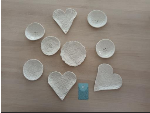
Les vide-poches en porcelaine créés avec Mme Siat