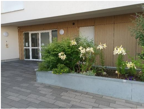
Les fleurs et les herbes aromatiques plantées autour de la Résidence