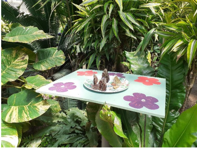
Le Jardin des Papillons