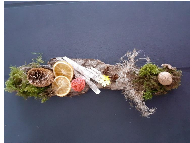
Activité manuelle à la période de Noël, centre de table