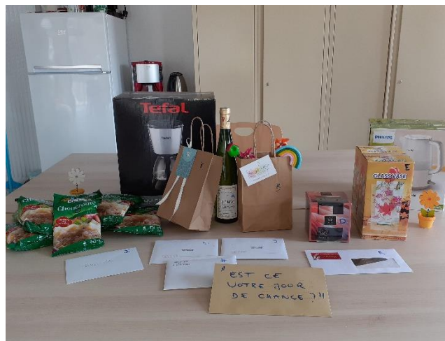
les lots du jeu « est-ce votre jour de chance ? »

Cadeaux aux résidents à l'occasion de leur anniversaire