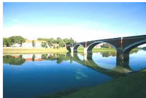
Sisak, ville croate

Et que manges-tu au petit déjeuner ? Je mange une tranche de pain, du beurre, du fromage, du thé blanc ou du café noir.