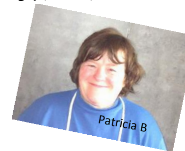
La pomme, petits (Vient de visionner « Blanche-Neige ») (Hervé L.)

« Un bon ami est difficile à trouver, difficile à perdre et impossible à oublier. »