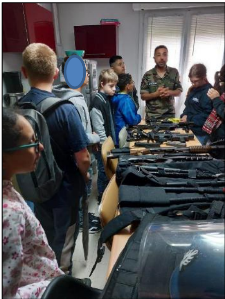
Présentation du matériel d'intervention