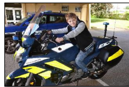
Mardi 24 mai 2022, nous avons visité l'escadron de gendarmerie de Wissembourg.